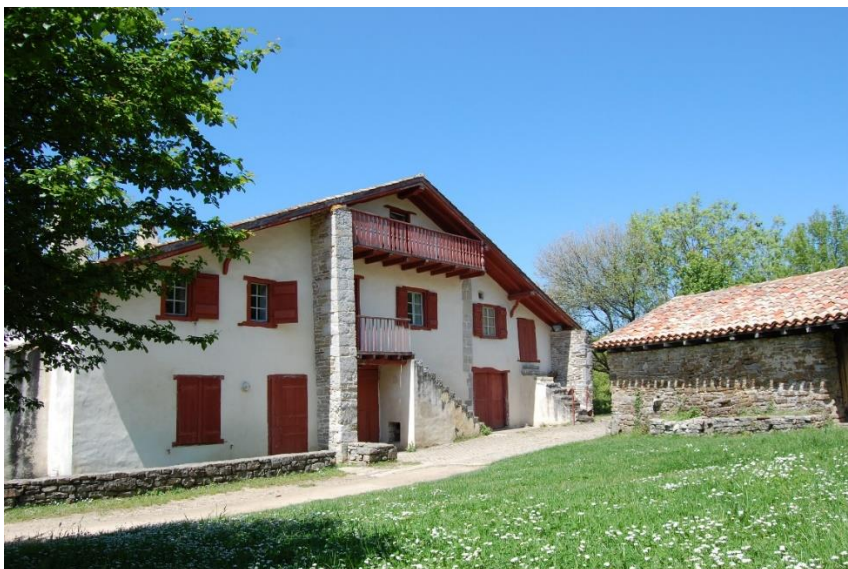
Abbadia eremuko Nekatoenea egonaldi tokia

Hautagaitza aurkezteko epea : 2021eko ekainaren 15a: jfrahier@hendaye.com