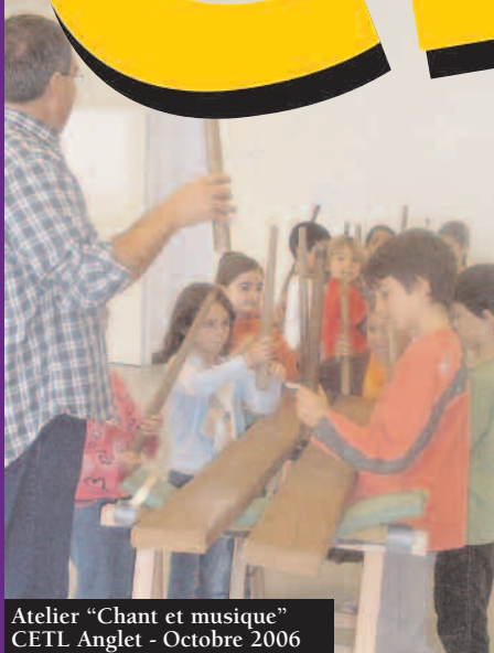
Atelier "Chant et musique" CETL Anglet - Octobre 2006