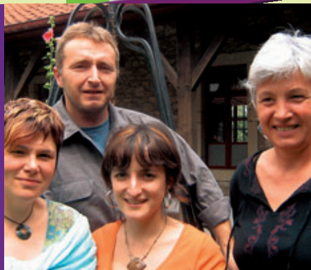
Les artistes entre Pays Basque et Géorgie