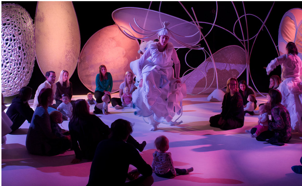
“MYRIADS OF WORLDS”