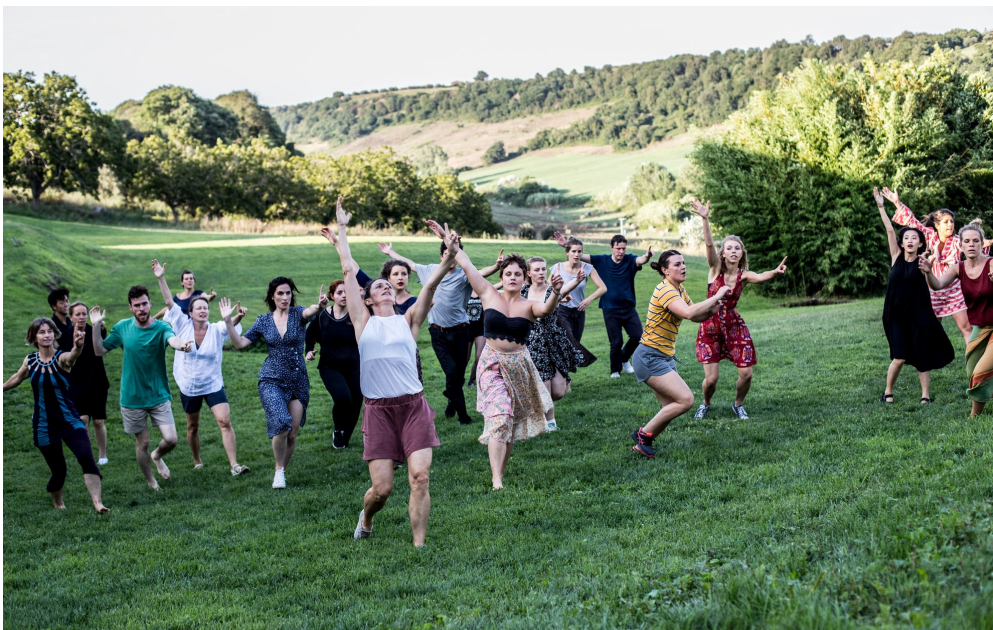
DANTZA ETA MUGIMENDU KLASEA