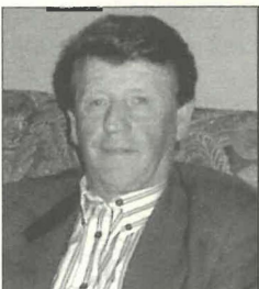
Airea: Zuk xarmaturik nago, arrosa ederra