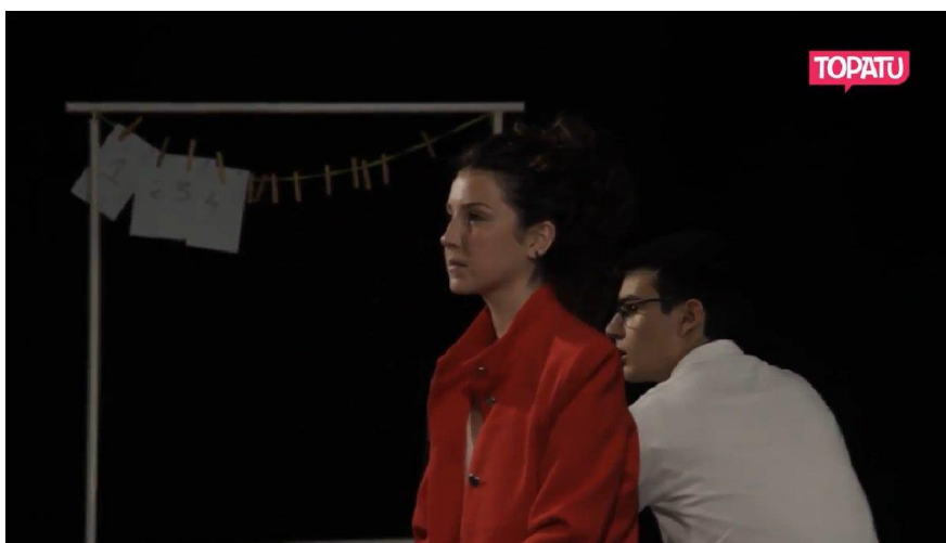
Etxepare Lizeoko antzerki tailerreko ikasleak – Ero ? antzezlanak

Atal honekin bukatzeko, dudarik ez da gazteak antzerkiarekin buruz buru jartzen segitu behar dugula. Ikasgelan berean, ikastetxean berean eta antzokietan ere bai. Hiru espazio horiek sinbolikoak baitira, gazteek beharrezkoak dituzten transmisio guneak.