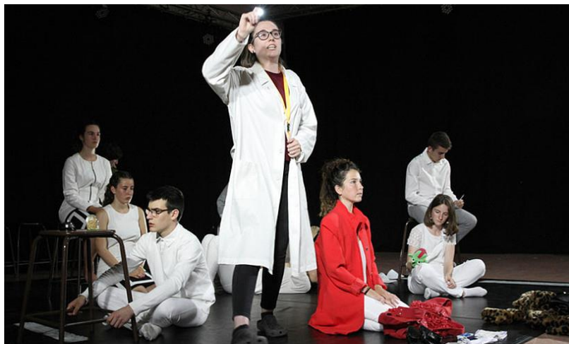
Ero ? antzerkia – Etxepareko ikasleak