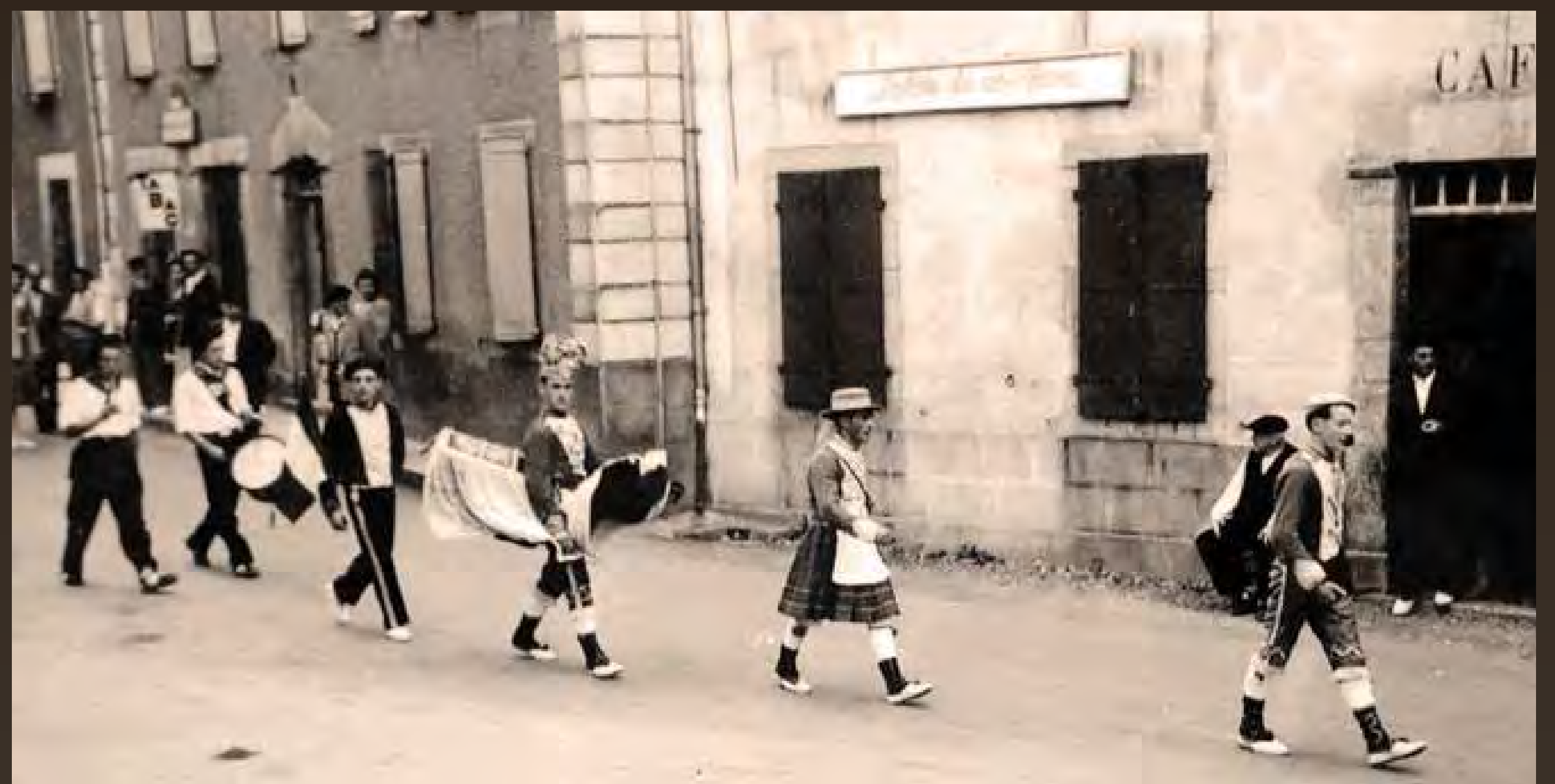
1946 - Atharratzeko merkatü plaza. « Lerdo egünez, maskaradak - heben, Urdiñarbeoak - Atharratzerat jiten ziren. Ez zen pentsatzekoa ere Atharratzerat jitea eta Bralerik ez emaita. Maskarada elibat beno haboro agitzen bazen jile, Bralea emanen züena xortatzen zen. »