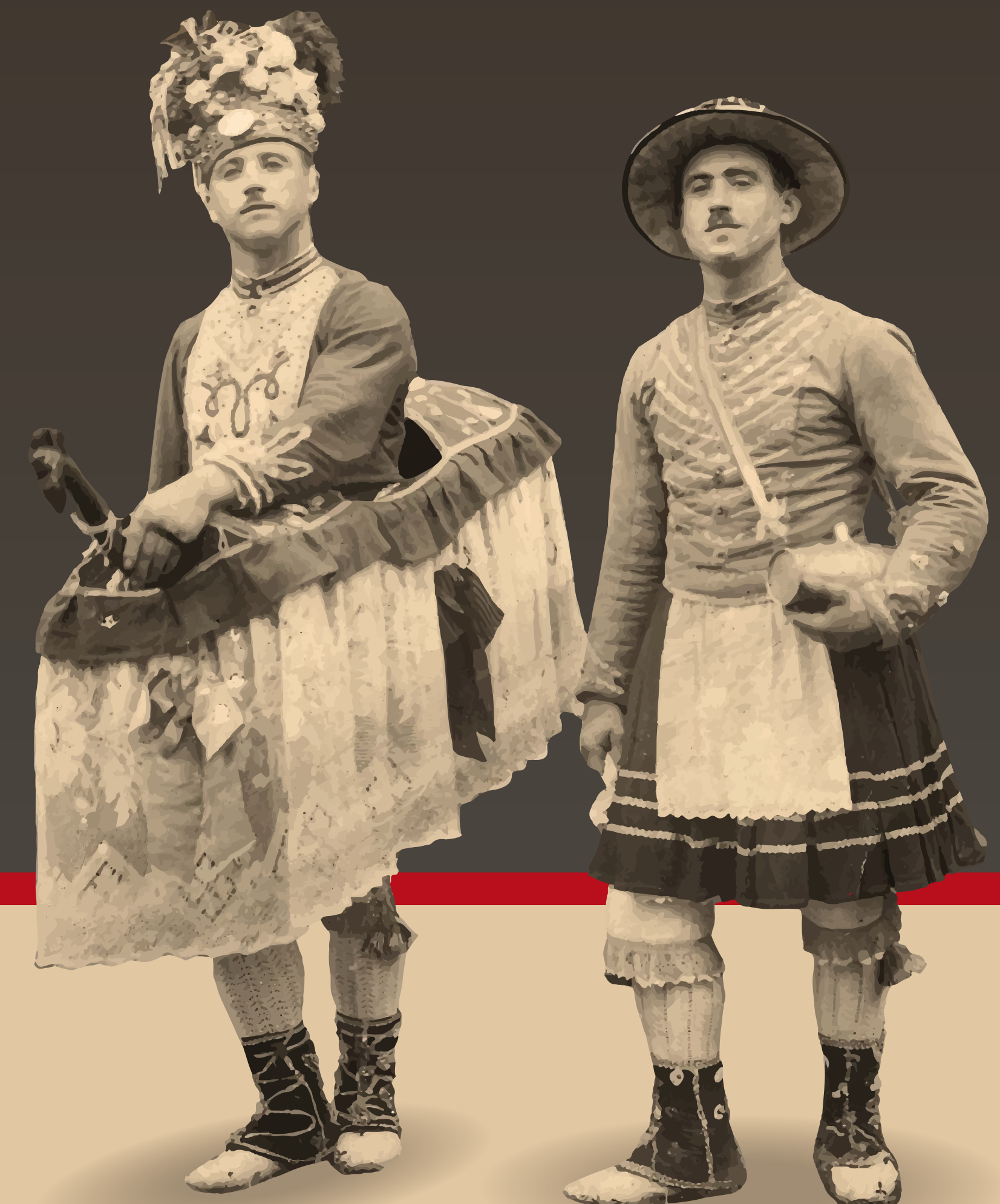
1946 - Place de Tardets. « Durant le Jeudi gras Tardets recevait chaque année les mascarades, ici celle d'Ordiarp. On ne pouvait concevoir aller à Tardets sans danser le branle. Lorsque plusieurs mascarades s'y retrouvaient, celle qui dansait le branle était tirée au sort. »