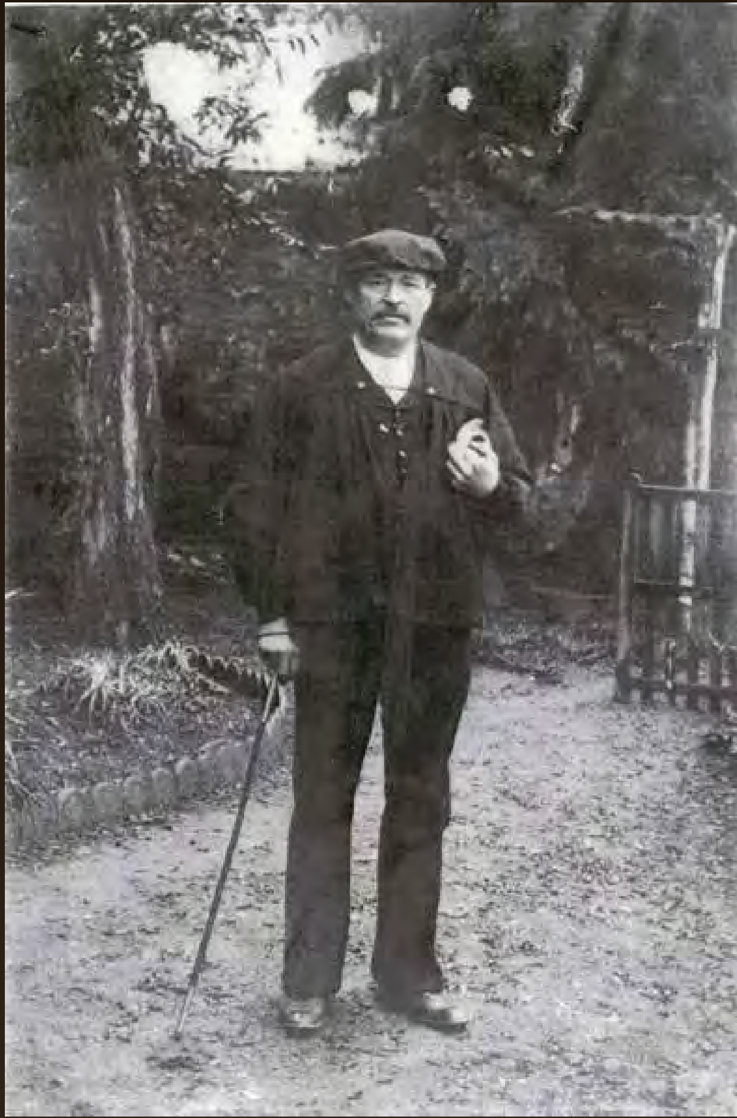
1890-1910 - Bürgübürü errejenta - Pastoral idazlea