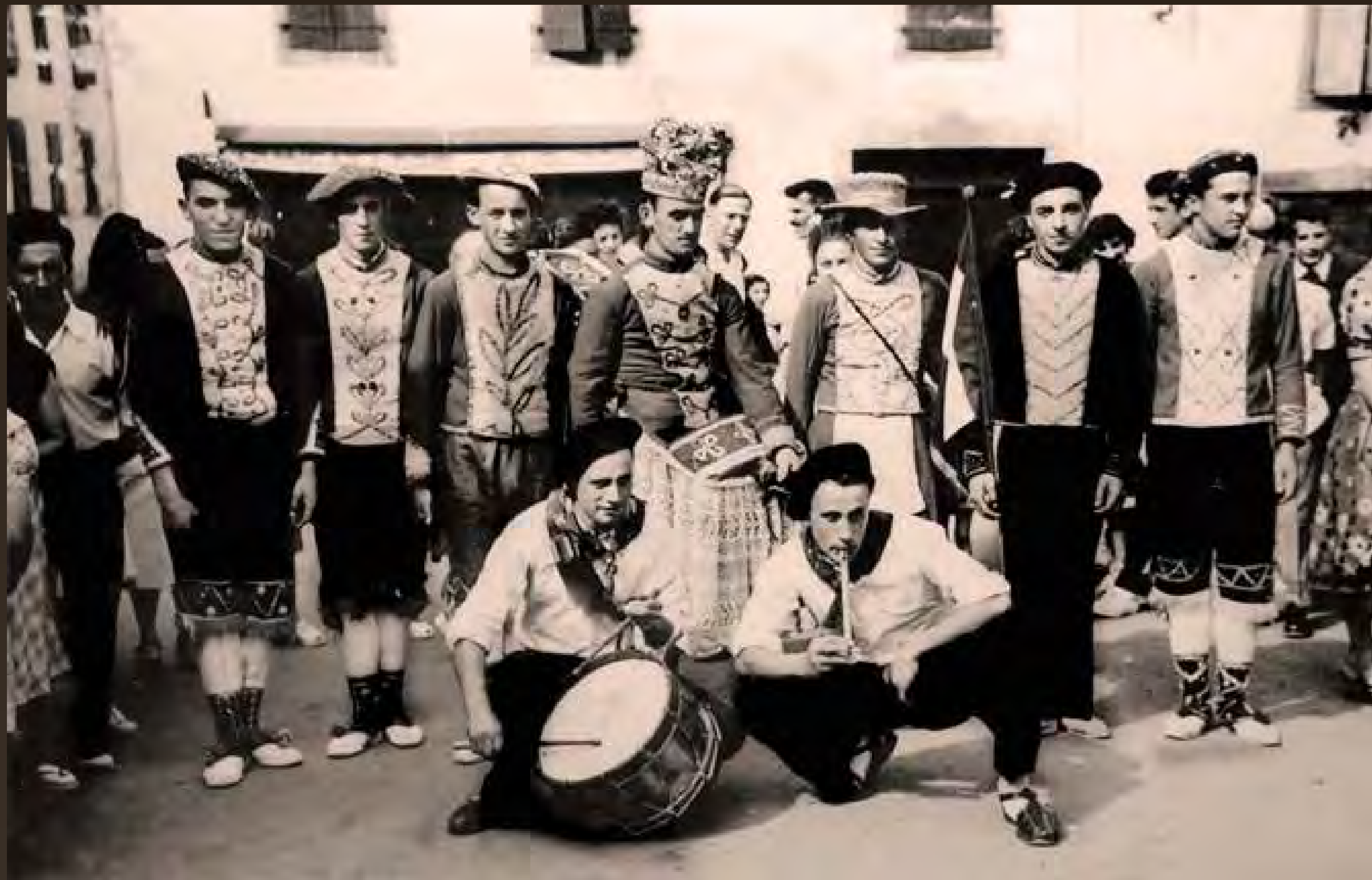
1950 - Atharratzeko jeien ostegüna / Fêtes de Tardets le Jeudi