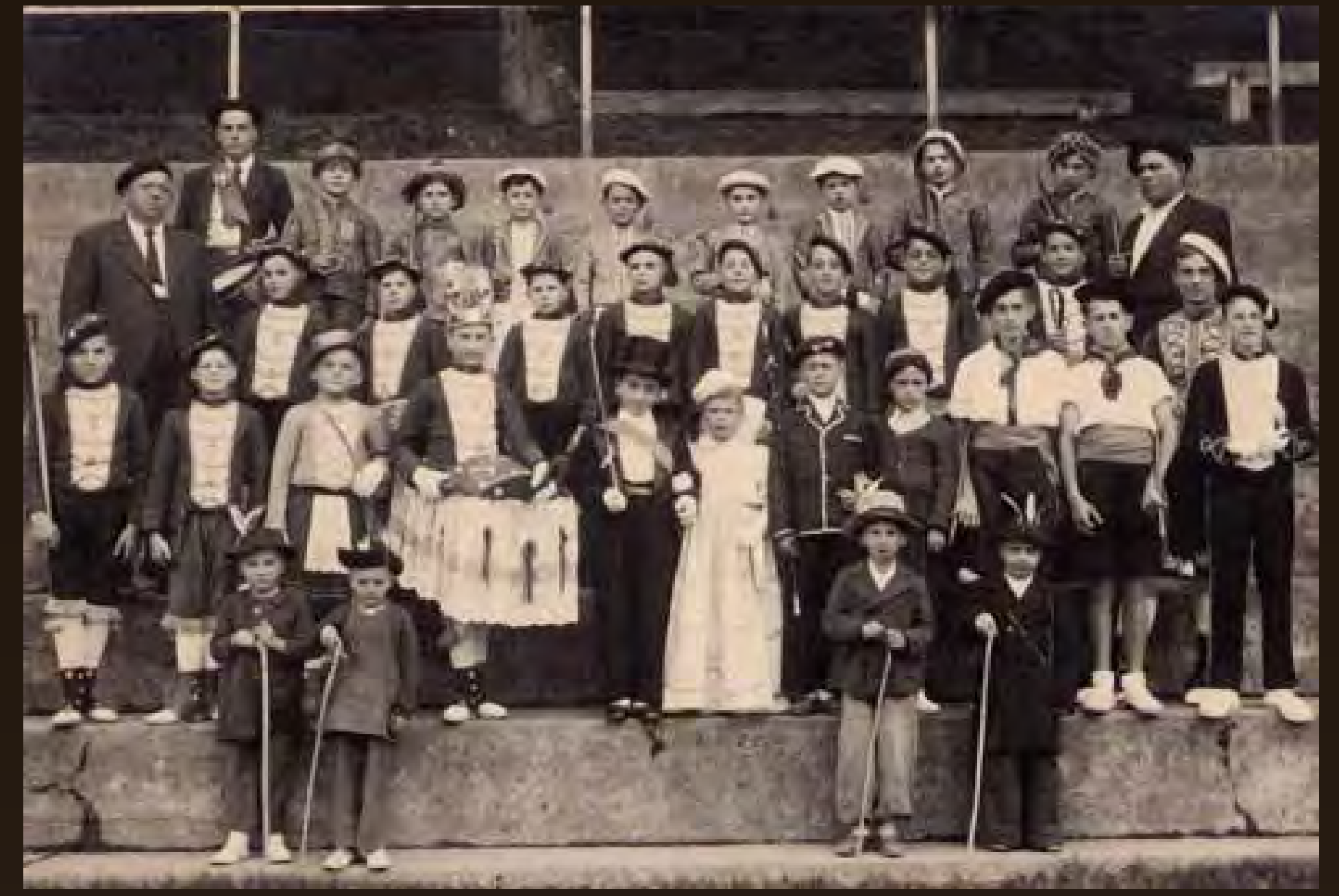
1945 - Hurren maskarak / Mascarade des Enfants.